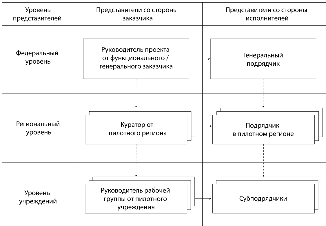
Рис. 2. Типовая структура группы управления проектом