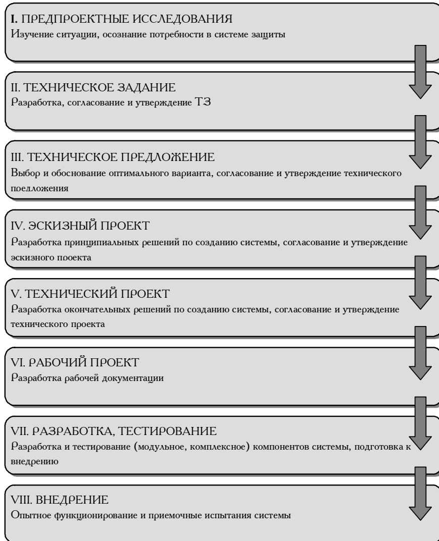
Рис. 2. Типовой жизненный цикл ИТ-проекта

Другое представление жизненного цикла задано отечественными нормативными требованиями к процессу создания ИТ-проектов, в том числе по проектированию систем защиты информации (рис. 2).